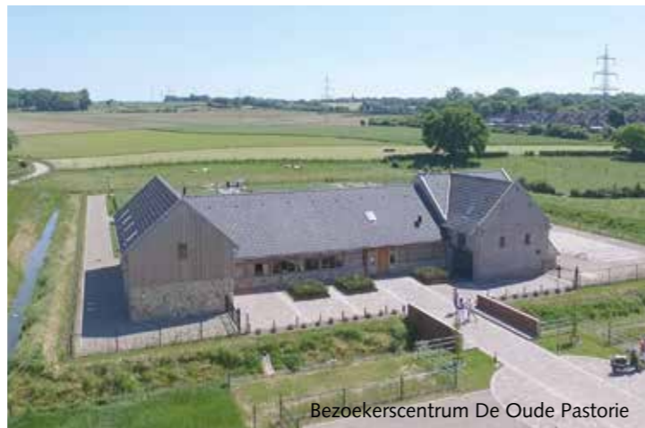
Bezoekerscentrum De Oude Pastorie