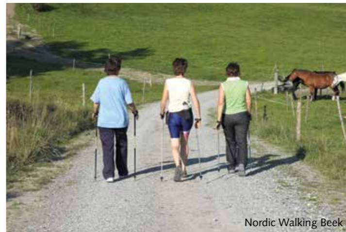
Nordic Walking Beek

Actie: Op vertoning van deze bon elk tweede kaartje 50% korting (goedkoopste kaartje/ max. 2 pers. per bon/niet i.c.m. andere acties).